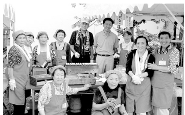
7月31日 各務原区夏祭り(各務原町コミセン) 地元各務原地区の夏祭りに参加。地元自治会の活動に、一市民として取り組んでいます。町内同士で親睦を深めることの大切さを実感しています。