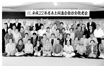
9月5日 赤土坂連合会自治会敬老会 関市赤土坂連合会自治会の敬老会に参加。地域の発展に永年ご尽力され、また自治の絆を深めて頂きました皆様に心から感謝。