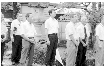
8月8日 岐阜県遺族会 岐阜地区慰霊塔巡拝(各地) 岐阜県遺族会による慰霊塔の巡拝に参加させていただきました。自らの命を犠牲にし、家族、国を想い敬慕された英霊の想いを政治に生かして参ります。