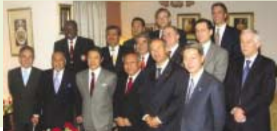
2/6 アドナン・ブルネイ大使との懇談会