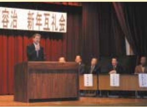
1/26 山県市後援会新年互礼会