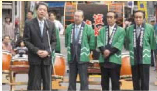
4/14 笠松 春まつり