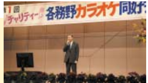
3/8 各務野カラオケ同好会の発表会にて 皆さんとともに熱唱