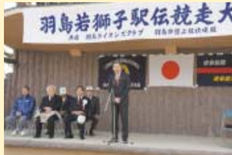
2/11 羽島若獅子駅伝開会式