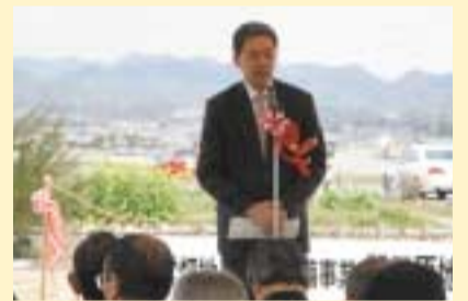
3/29 関市 田原土地改良区完成式