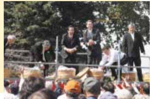
3/16 おがせ池八大龍王殿にて再建落慶を祝って餅まき