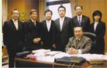
1/17 関市議団とともに渡辺喜美行政改革大臣を訪問 行政改革・地方行政のあり方など意見交換