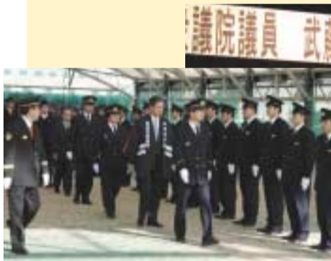
1/6 岐南町消防出初式