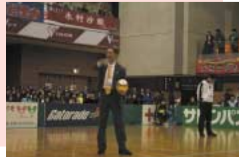
1/27 Vプレミアリーグ女子・関大会にて始球式