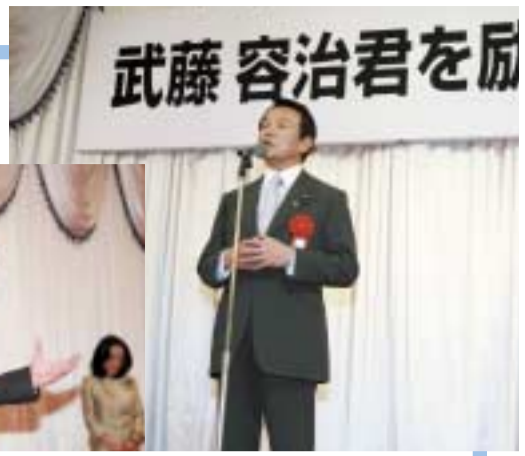
2/26 麻生太郎先生はじめ多くの方から激励をいただきました