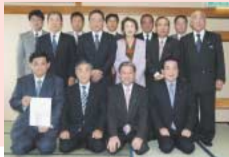
4/27 瑞穂市議及び県連幹部の皆さんとの懇談会