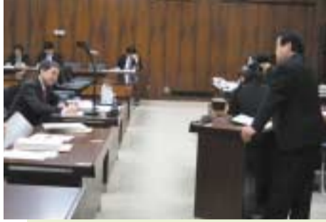
2/28 予算委員会第8分科会にて、冬柴国土交通大臣(右端)に質問 道路特定財源の重要性を訴える