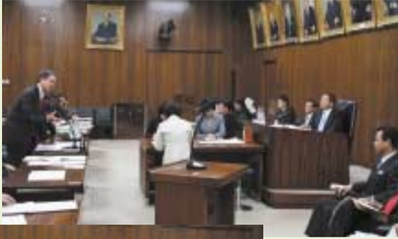
3/25 経済産業委員会にて、甘利明大臣(右端)の所信表明に対して質問