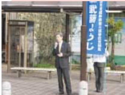
3/17 街頭演説にて国民目線の政治を訴える (JR穂積駅)