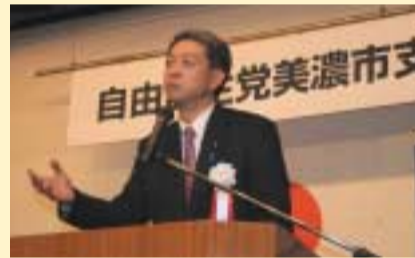
1/26 自民党美濃市支部 新年互礼会