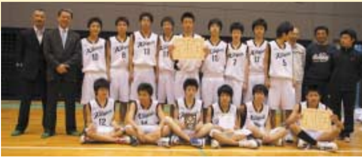
3/30 北方カップ バasketボール大会にて北方中チームの皆さんと